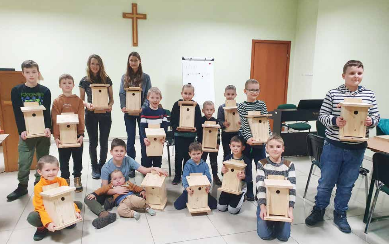
Budowanie budek lęgowych dla ptaków str. 82