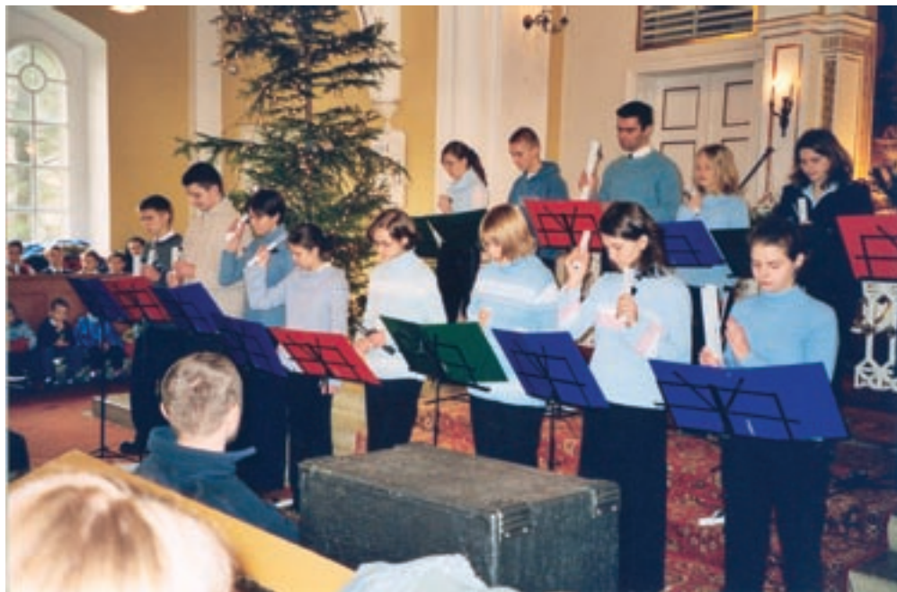
Młodzieżowy zespół dzwonek

W parafii działają chóry: dziecięcy, młodzieżowy zespół śpiewaczy, młodzieżowy zespół dzwonek, chór mieszany „Gloria” obejmujący także chóry męski i żeński. Chóry usługują śpiewem podczas uroczystości parafialnych, pogrzebów, ślubów, organizują koncerty kolęd i pieśni