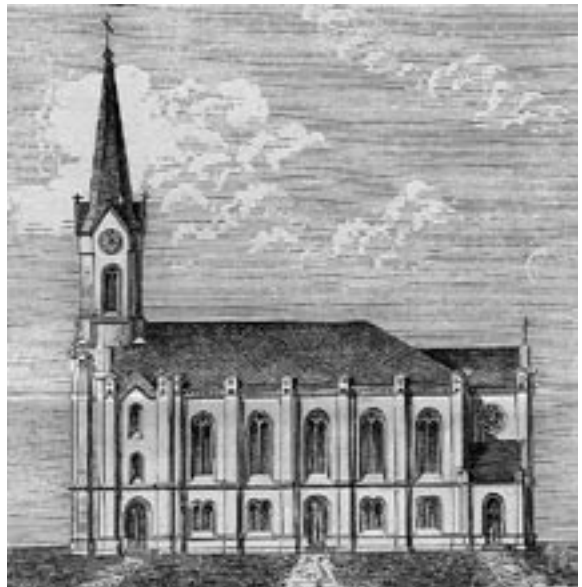
Projekt kościoła (rycina z 1863r.)