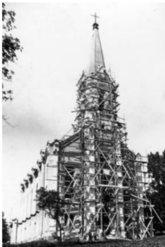
Instalowanie zegara (1928r.)